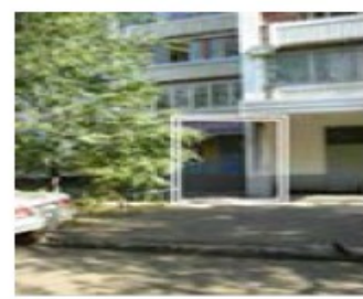
Рис. 4. Месторасположение парикмахерской

Собственнику желательно создать поток посетителей хотя бы 150 человек в неделю. Ассигнования, выделенные собственником на продвижение парикмахерской – не более 100 000 рублей. На той же улице четыре месяца назад открылась парикмахерская-конкуренент на 4 посадочных места. Никаких услуг, кроме стрижки, не оказывают. Помещение крохотное, люди ждут своей очереди прямо в салоне. Работают 18-летние гастарбайтеры из Молдовы и Украины.